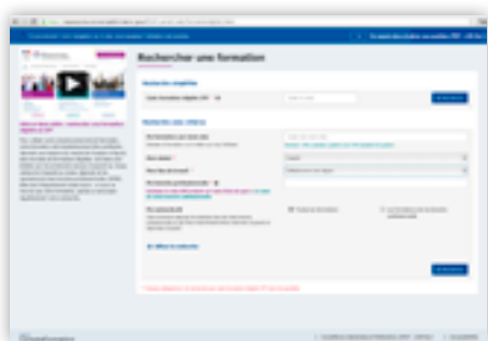
Les formations accessibles dans le cadre du CPF varient selon des critères propres au titulaire du compte : statut, lieu de travail, certification visée...